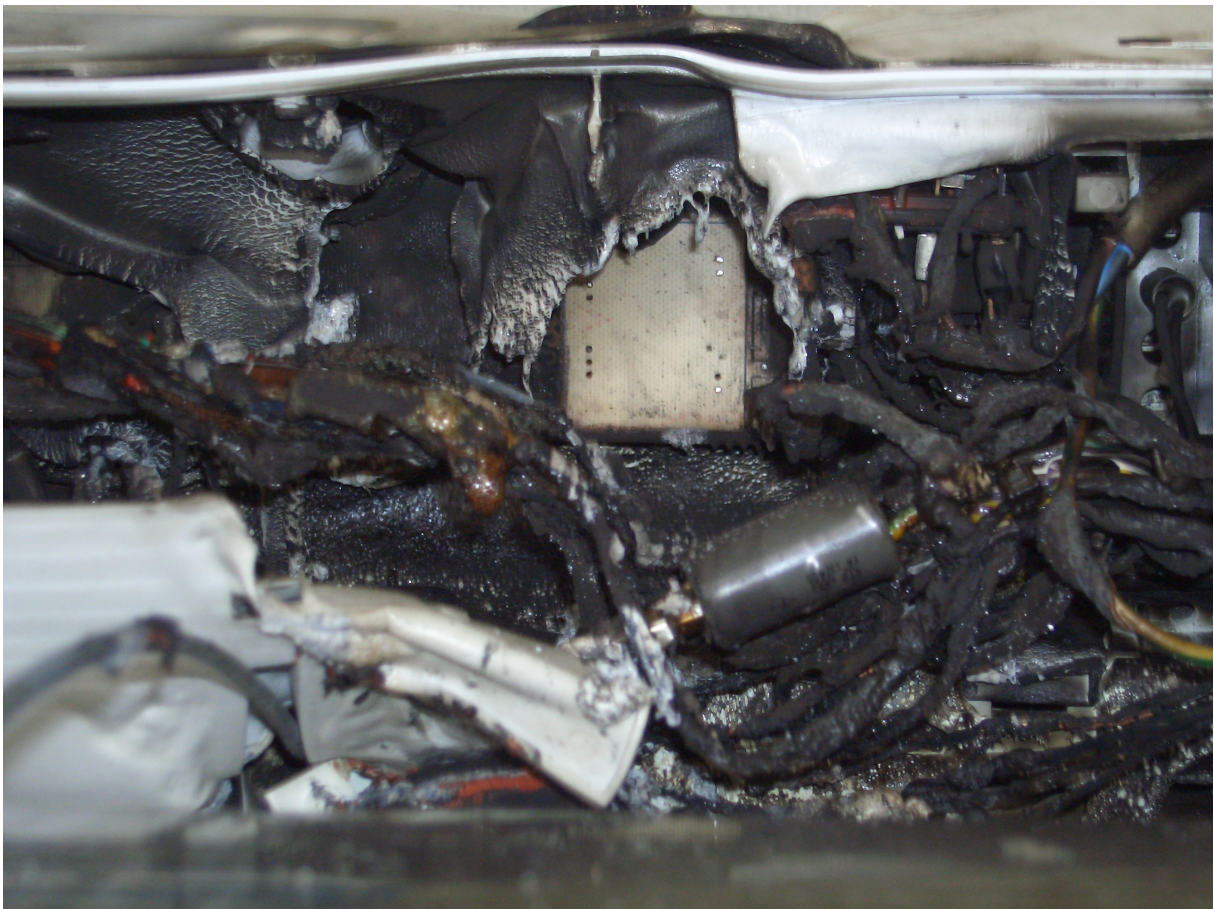
Blick unter die Bedienkonsole, die im Inneren ausgebrannt ist.