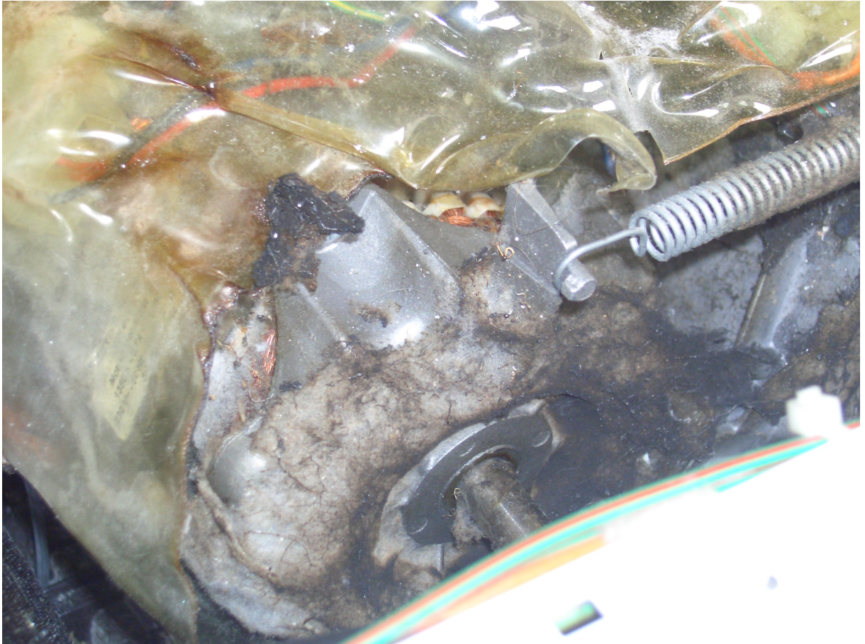
An dem überhitzten Antriebsmotor für die Trommel kam es ebenfalls zum Brand.